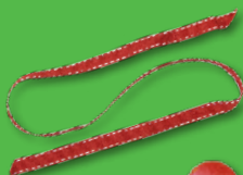
nastrino colorato e bottone