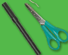
pennarello e forbici

1 Riempi la punta di un calzino con dell'imbottitura per cuscini o del cotone e lega questa parte con uno spago. Poi infila altra imbottitura, ma non riempire tutto il calzino, e lega anche questa seconda parte (vedi foto).